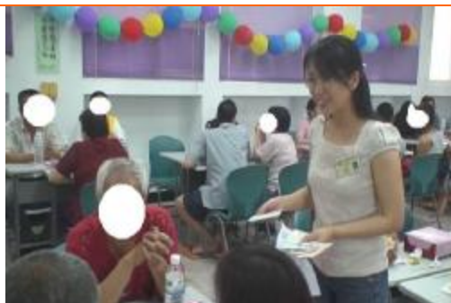
高雄縣毒防中心人員入所宣導