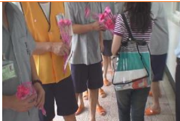
手持康乃馨給母親一個溫馨