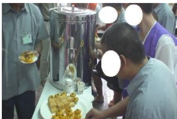
小吃班成果展示提供同學點心享用