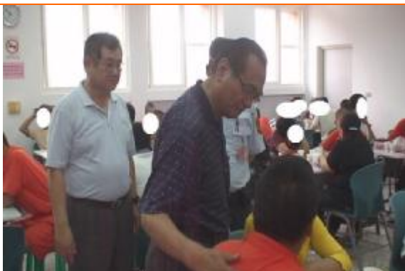
邱所長關心同學在所情形

本所與嘉南療養院、高雄縣毒品危害防制中心、高雄地方法院檢察署暨財團法人臺灣更生保護會高雄分會合作辦理戒治所暨分監收容人 99 年母親節懇親系列活動，活動花絮如下：