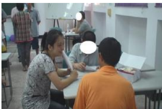
黃社工陪家屬晤談子女在所情況