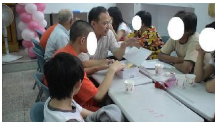
白心理師與家屬晤談提供家屬建言