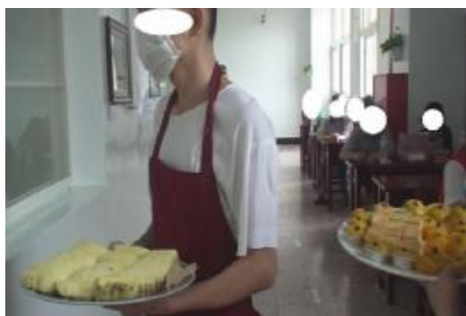
小吃班提供懇親同家屬品嚐小吃點心