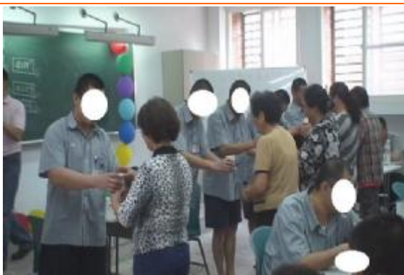
家庭日活動-同學學習奉茶孝親