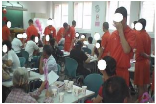
少觀同學感動落淚