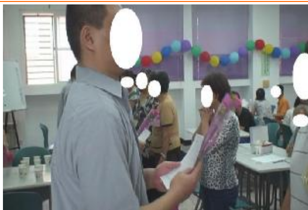
成年收容人手持賀卡及康乃馨準備獻花