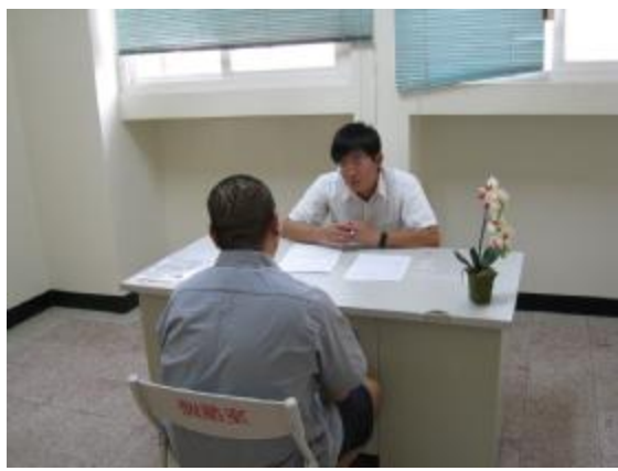
醫師為受戒治人進行精神狀態評估