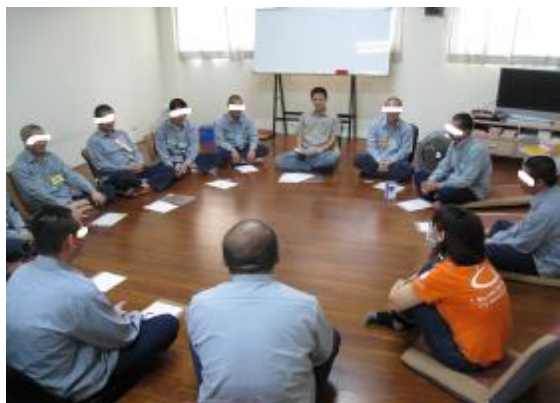
嘉南療養院職能師與本所社工員帶領生涯輔導團體