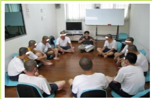
社工員帶領認知戒癮團體