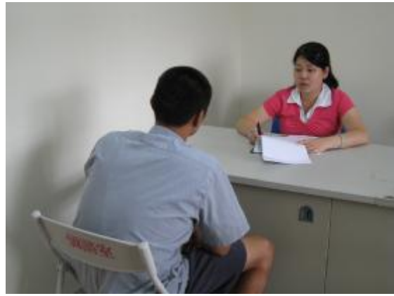
護理師對愛滋帶原者進行輔導