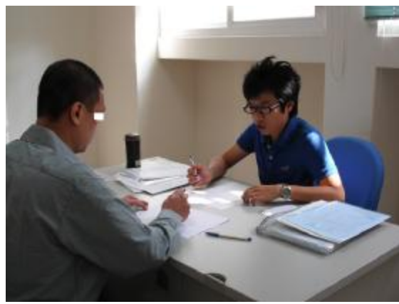
臨床心理師為受戒治人進行心理衡鑑