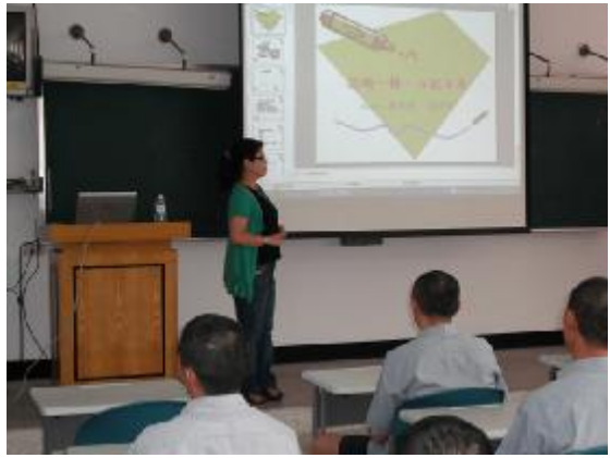
護理師進行小班反毒衛教