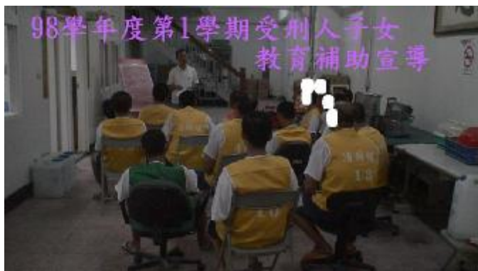
教育補助宣導一景