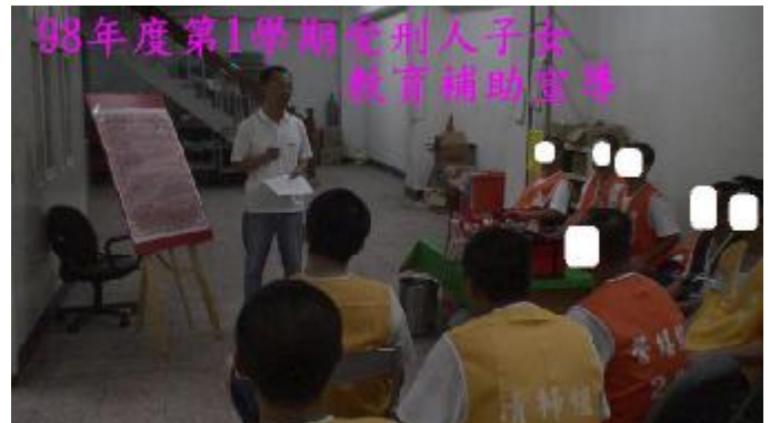
教育補助宣導一景