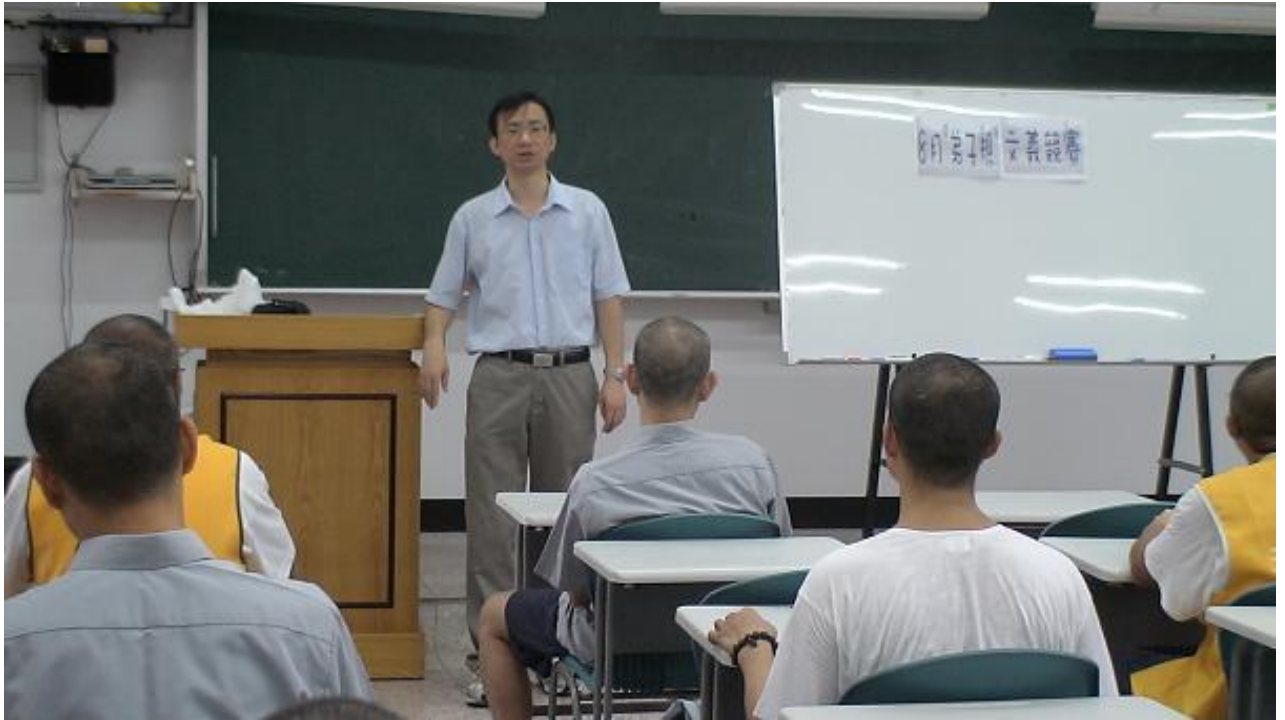
輔導科長宣導“弟子規文義解釋競賽辦法”

辦理98年8月份文康競賽活動，配合法務部宣導儒教、道教、佛教之教化精神，進行文義解釋競賽活動，比賽採紙筆測驗包括填空、文義翻譯及心得分享等三部分，計有20位各教室代表參與。活動剪影如下：