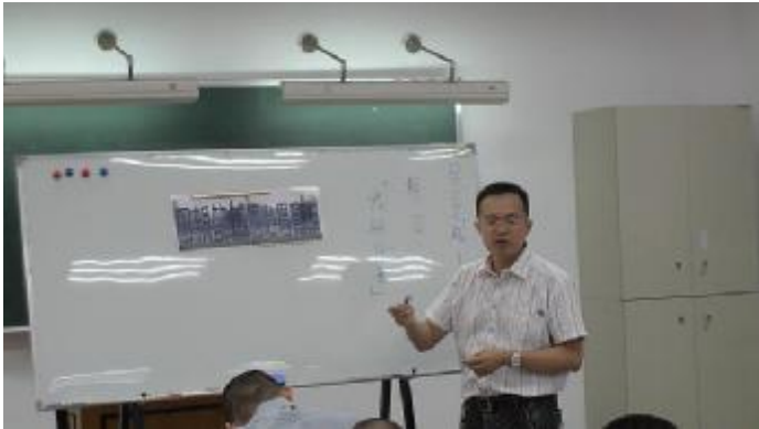
王輔導員公布寫作題目

辦理四月份文康活動競賽依「臺灣高雄戒治所98年度收容人文康活動計畫表」進行活動。活動剪影如下：