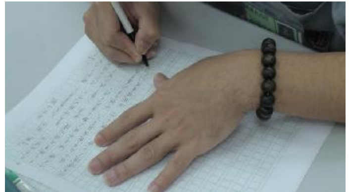
同學認真寫作一景