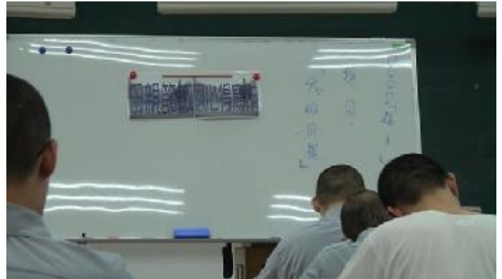
同學認真寫作一景